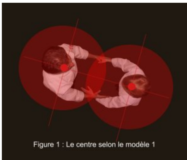
Figure 1 : Le centre selon le modèle 1

De mon étude du Yin et du Yang en Aïkido, j'ai retiré qu'il existe deux approches possibles par rapport à ce « centre ». Nous allons donc tâcher de les définir toutes les deux, mais au préalable, nous devons nous accorder sur ce qu'est le centre. Lorsque je suis seul, mon centre est situé quelques centimètres sous mon nombril. C'est le concept de hara bien connu des Aïkidoka et des pratiquants d'arts martiaux. Ce concept ne pose pas problème de compréhension. Cela dit, tout se complique quand un partenaire entre en jeu. Que se passe-t-il alors ? C'est ici que s'esquisse la différence fondamentale entre les deux approches.