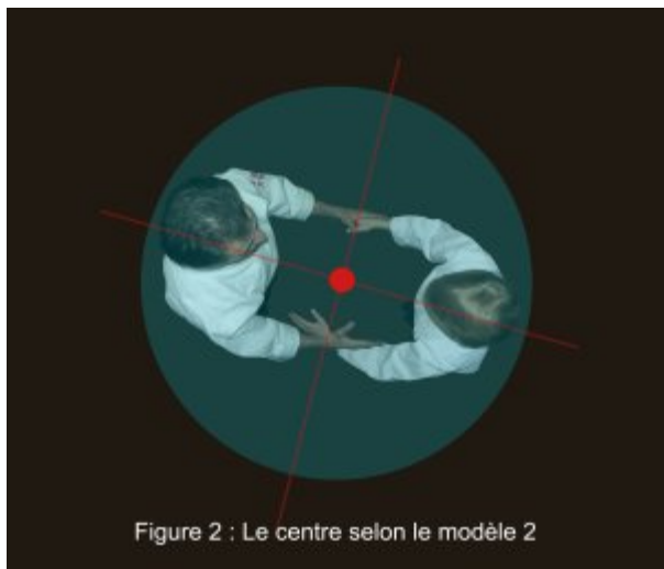
Figure 2 : Le centre selon le modèle 2

On trouve de nombreux exemples illustrant cette idée dans la nature. Dans le domaine de la physique par exemple, le centre de gravité d'un solide est défini comme « point d'application de la résultante des forces de gravité de tous points du solide ». En clair : l'ensemble des forces appliquées est nul. C'est l'équilibre, l'harmonie. Un autre exemple en géométrie : le centre de gravité d'un triangle est évident, il se trouve quelque part à l'intérieur. Mais si l'on joint deux triangles par un de leur côté, leurs centres de gravité respectifs, définis précédemment disparaissent au profit du centre de gravité du quadrilatère résultant. De deux centres distincts, on passe à un seul : c'est le fameux « 1+1=1 ».